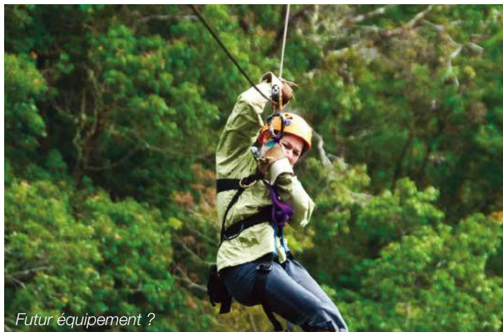
Futur équipement ?