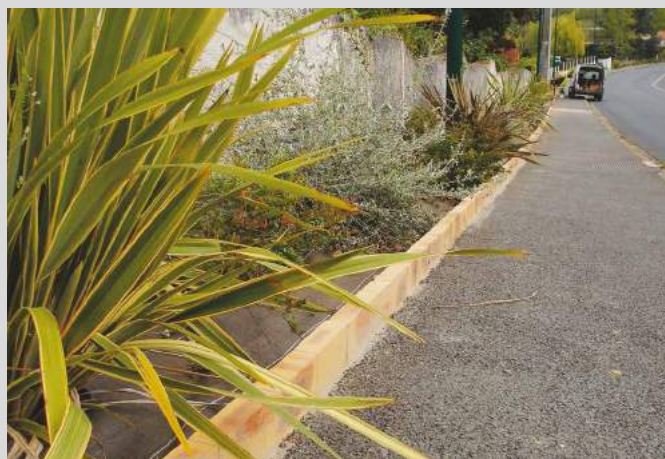
Route de l'Eglise : La finition des plates-bandes a été réalisée avec des briquettes. La bâche sera ensuite recouverte par des écorces de pin.