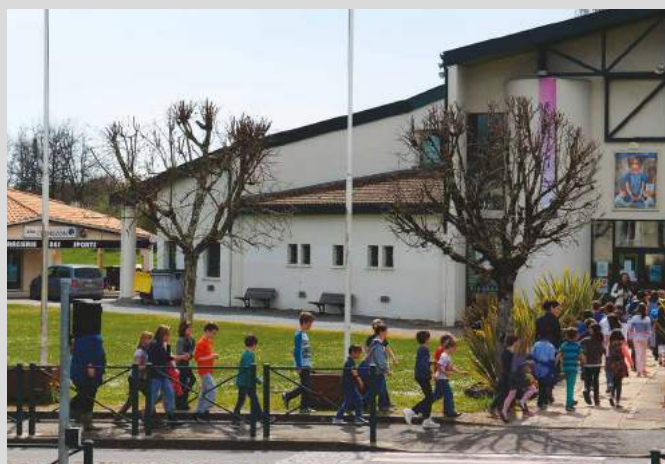
Les élèves de l'école élémentaire se dirigent vers le cinéma pour une séance choisie à leur intention (voir article).