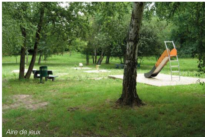
Aire de jeux