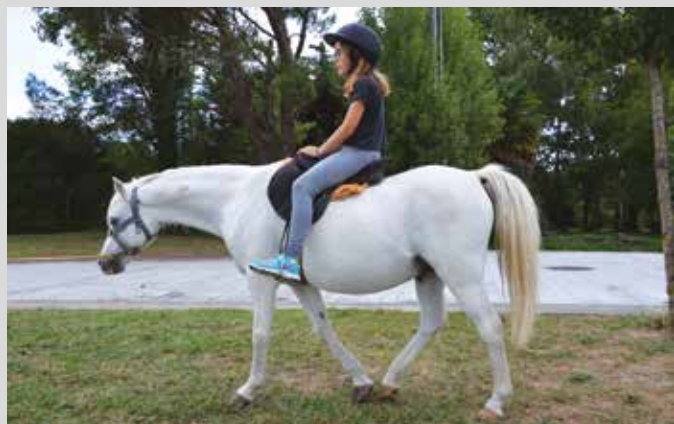
Défi sport, le samedi 5 septembre