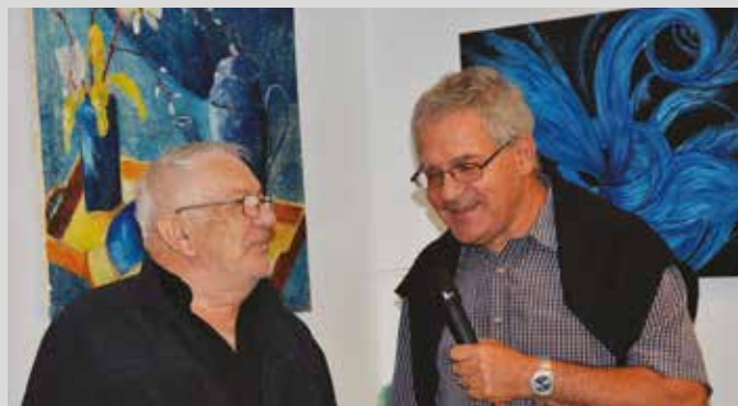
Espace citoyen, vendredi 4 septembre // Vernissage d'œuvres d'artistes locaux à la Maison des Solidarités et concert vocal à l'église.