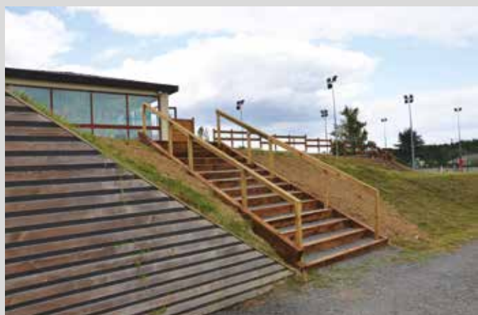
Travaux stade : escaliers en bois construits pour passer du niveau tennis et gymnase au niveau terrain de foot et vestiaires.