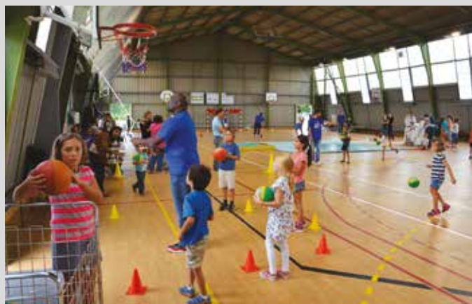
Défi sport, le samedi 5 septembre