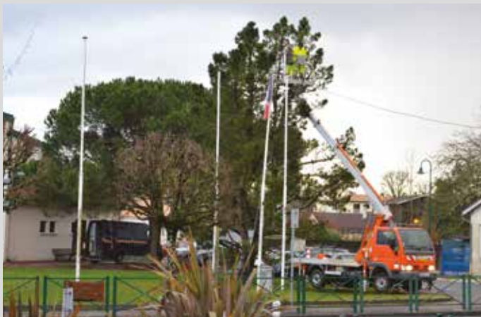
Enlèvement des guirlandes par le service technique de la Mairie.