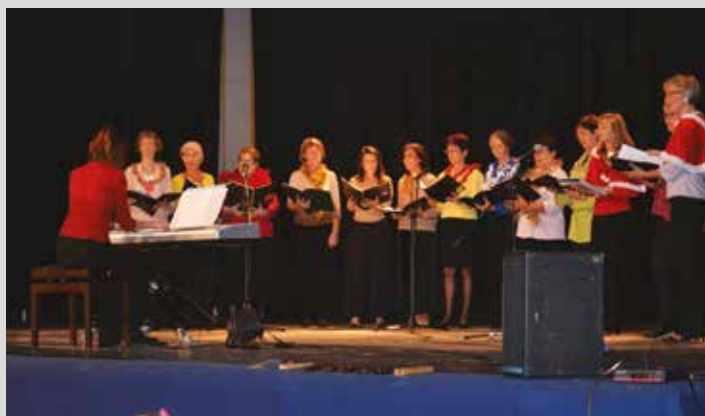
Samedi 19 décembre, spectacle de la chorale organisée pour le Noël des enfants.