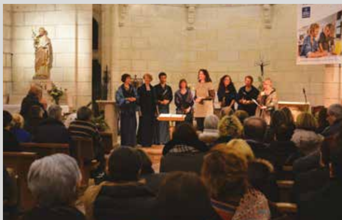
Concert du groupe vocal féminin Castafiori à l'église, dimanche 10 janvier.