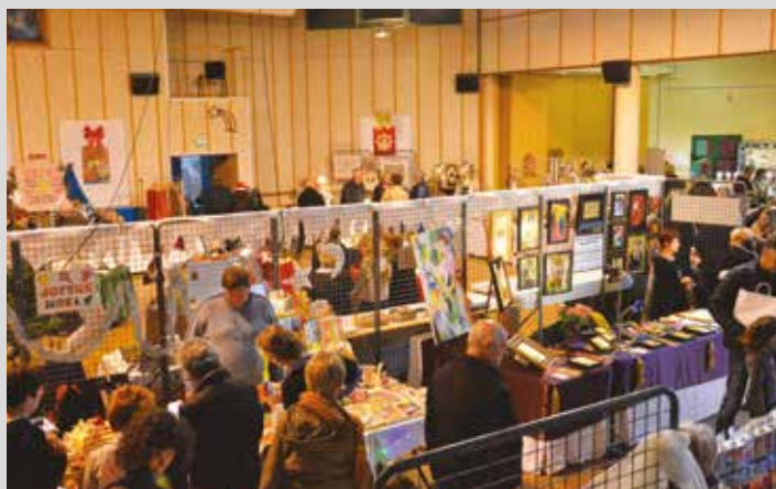
Marché de Noël des 28 et 29 novembre organisé par l'AREP.