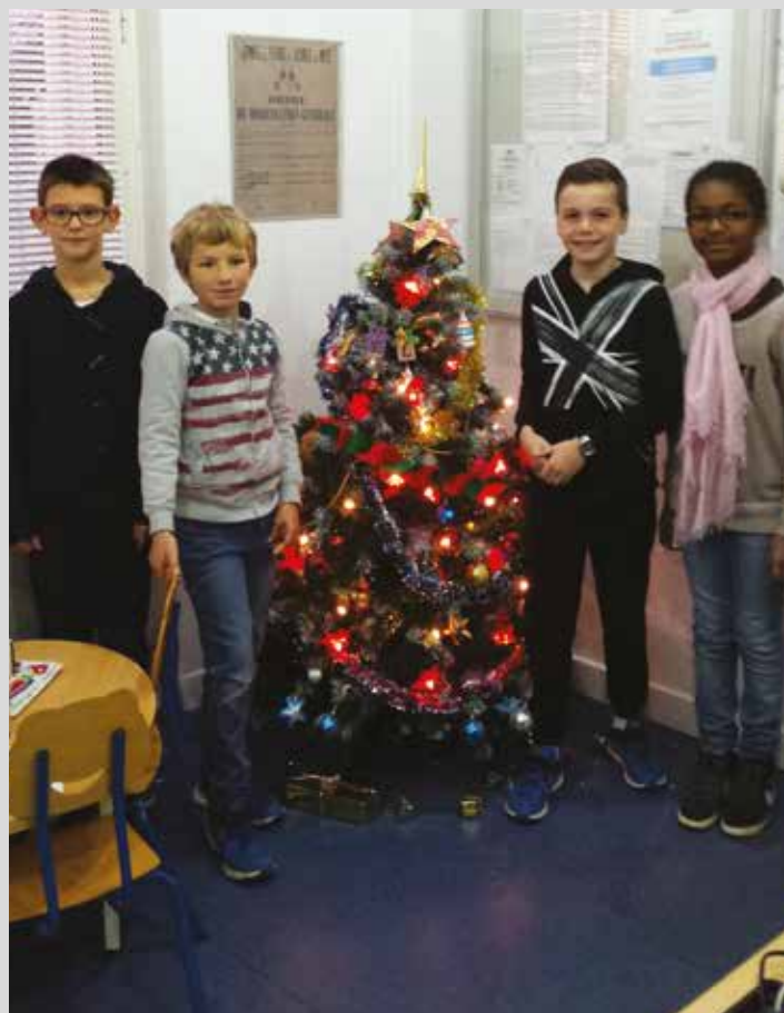
Sapin de Noël décoré par les enfants du périscolaire.