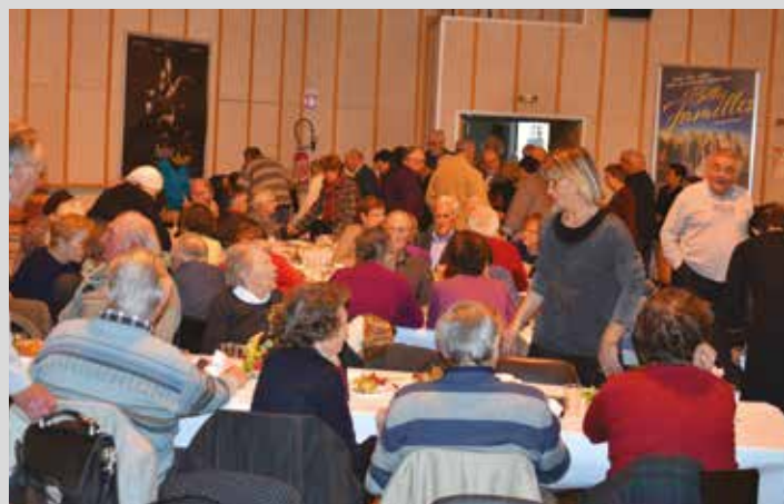
Jeudi 17 décembre, goûter de Noël des aînés.