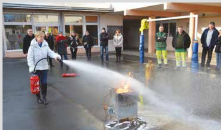
Formation à la lutte contre l'incendie des personnels et des responsables associatifs, 6 janvier 2016.