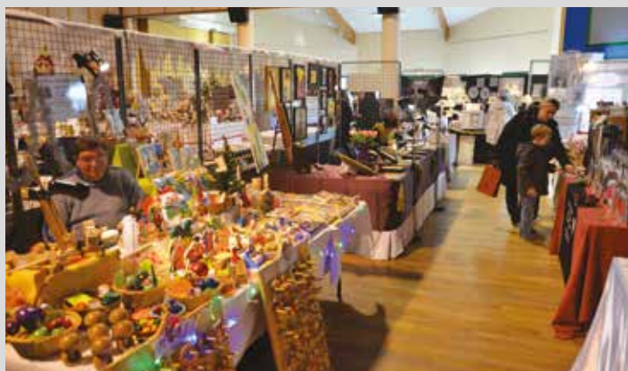
Marché de Noël des 28 et 29 novembre organisé par l'AREP.