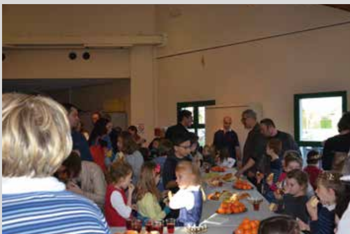
Samedi 19 décembre, salle des fêtes : après-midi offerte par la Mairie aux enfants : au programme mini-concert des enfants de l'éveil artistique et de la chorale adultes ( chants de Noël ) à 14h, suivi du traditionnel ciné-goûter des enfants "Neige et les arbres magiques" 4 courts-métrages de 51min dès 4 ans et des jeux proposés par la Ludothèque Terres de Jeux.