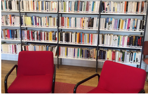
Nouvelle équipe à la bibliothèque p.8