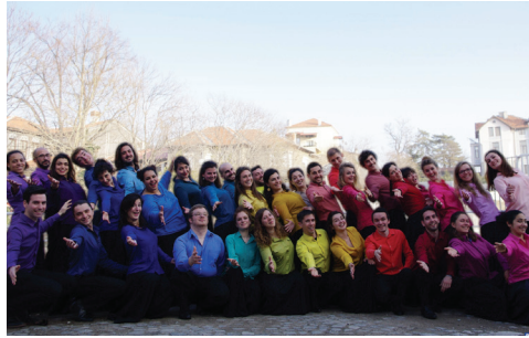
Concert choral p.13