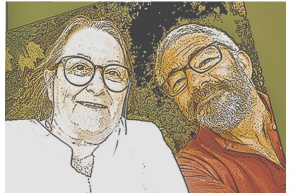
Un Point C Nous

6 juin - Salle des fêtes Journée des Ateliers de 18h à 23h, ce sera l'occasion de fêter les 30 ans de la Compagnie de la Laurence. 3-4-5 juillet à Villagrains (Cabanac et Villagrains) Festival «Scènes Buissonnières».