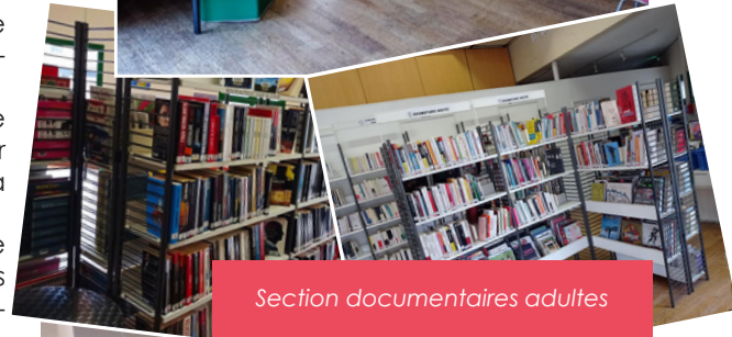
Section documentaires adultes