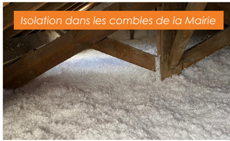
Isolation dans les combles de la Mairie

Cette opération intégralement gratuite va par ailleurs permettre des économies de chauffage et donc une réduction à venir des factures gaz et électricité.