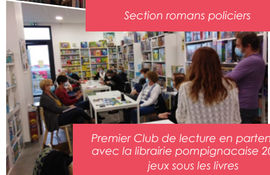
Premier Club de lecture en partenariat avec la librairie pompignacaise 20 000 jeux sous les livres