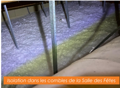
Isolation dans les combles de la Salle des Fêtes