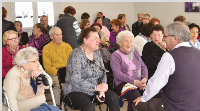
Vœux des Solidarités.