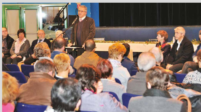
Vœux du Maire.