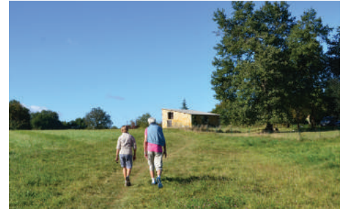
A pied à vélo p. 15