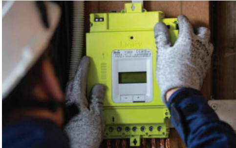
Linky, ce qu'il faut savoir (2) p. 8-9