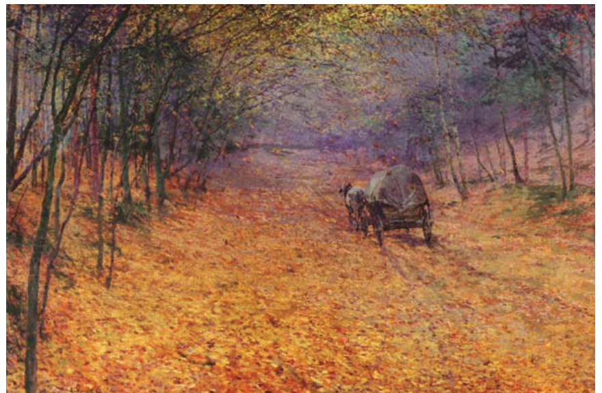
Antonin Slavicek, Dans le brouillard d'automne, 1897.