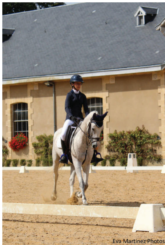
Eva Martinez Photos