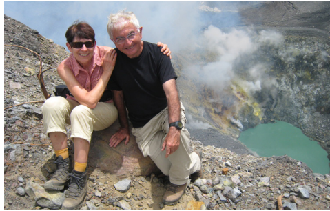
Programme Espace Citoyen p. 8