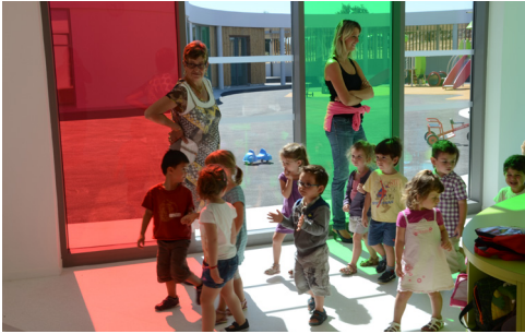
Les infos de la rentrée scolaire p. 4-5