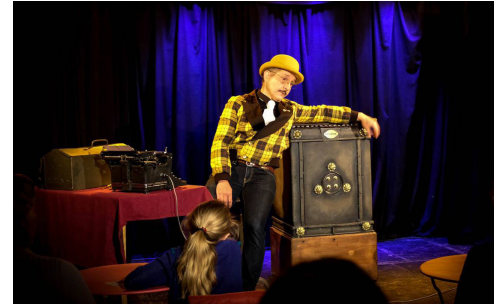
Spectacle théâtre enfant p. 10